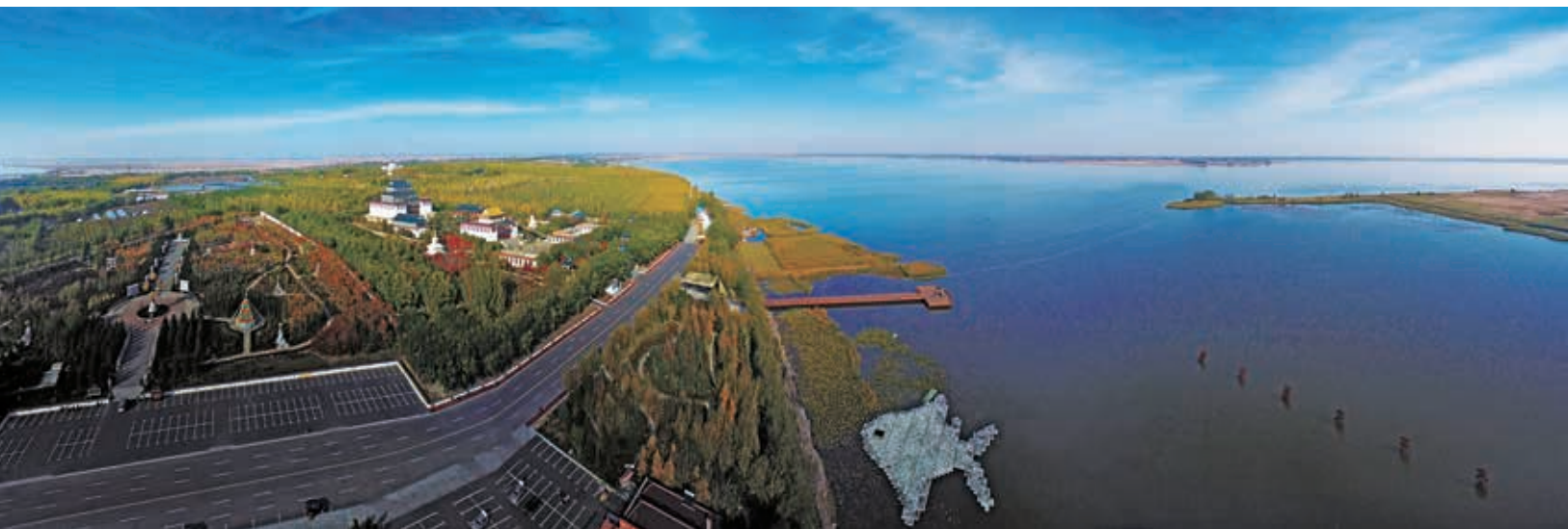
Цилиньское месторождение закрыло нефтяные скважины в буферной зоне национального природного заповедника к озеру Чаган для защиты местной экологической среды