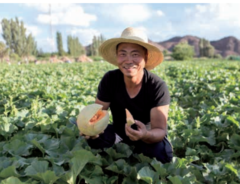
Корпорация и Китайский фонд борьбы с бедностью осуществляют проект «Интернет и борьба с бедностью», чтобы помочь фермерам уезда Баликун Синьцзяна продавать дыню через интернет

Активно откликаясь на «Повестку дня в области устойчивого развития на период до 2030 года» ООН и политические курсы правительства КНР по сокращению и ликвидации бедности, сосредоточиваясь на 4 основных сферах, а именно – благосостояние народа, производство, выявление умного потенциала и медицина, на основе сочетания своей деятельности с ресурсными и рыночными преимуществами конкретных регионов, Корпорация ведет целенаправленную работу по оказанию адресной помощи в целях стимулирования развития этих регионов. В 2018 году Корпорация направила 97,49 млн. юаней на осуществление 44 проектов по модернизации инфраструктуры, образованию, медицине и здравоохранению, производственной кооперации в 13 уездах (районах) СУАР, Тибета, Цинхая, Чунцина, Хэнань, Цзянси и Гуйчжоу, в результате чего более 80 тыс. человек получили реальную помощь.