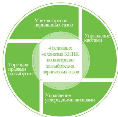
Системы и механизмы КННК по управлению выбросами парниковых газов